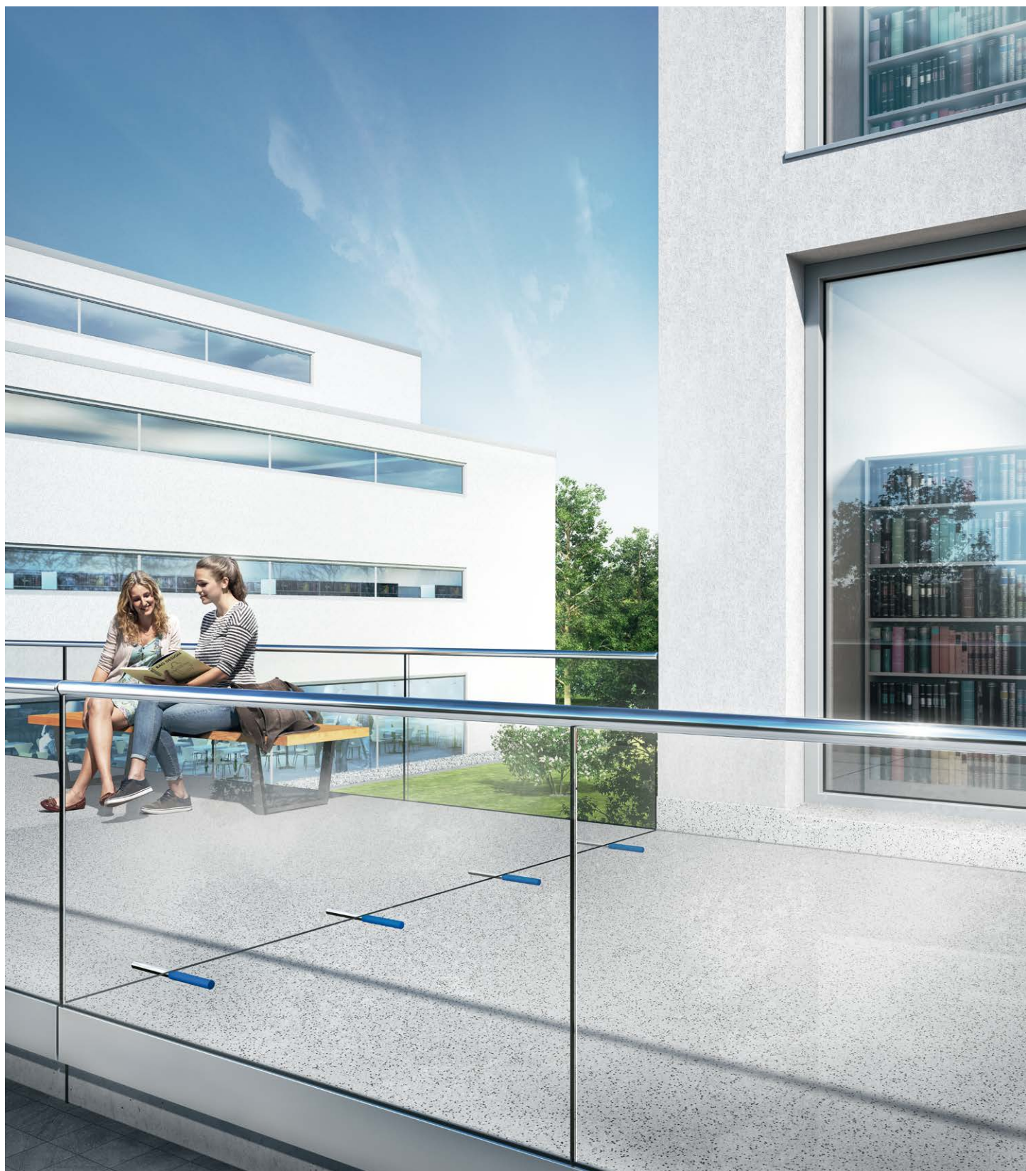
Smykový trn Zkrátka silák