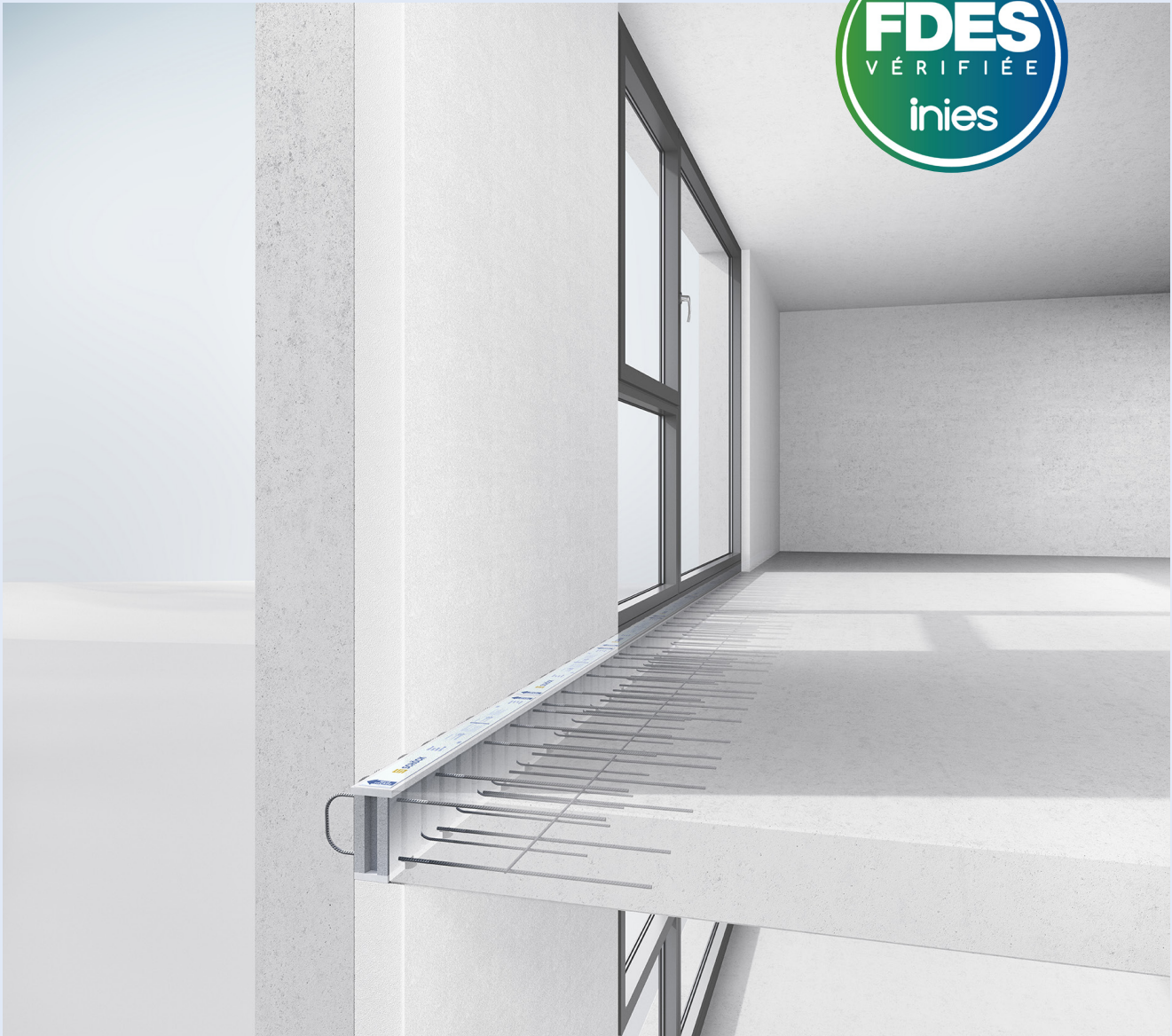
Schöck Rotherma ® DFi

Il y a 3 ans déjà, Schöck France se démarquait en étant le premier industriel à obtenir une FDES 1 pour ses rupteurs Rotherma ® type DF/ DF-VM. En ITI, éléments de jonction entre la dalle intérieure et la façade (la variante VM autorisant une mise en œuvre dans le cas de voile mince), ils permettent de réduire jusqu'à 85 % des déperditions énergétiques générées par les ponts thermiques. Cette FDES inaugurale (valable jusqu'au 1 er janvier 2024) se complète aujourd'hui d'une seconde. Celle-ci s'étend à l'ensemble de la gamme Rotherma ® en isolation thermique par l'intérieure, dont la dernière innovation DFi, poids plume en carbone. Les donneurs d'ordre, prescripteurs et thermiciens, peuvent dès lors atteindre plus facilement les performances en matière de poids carbone de leurs projets constructifs.