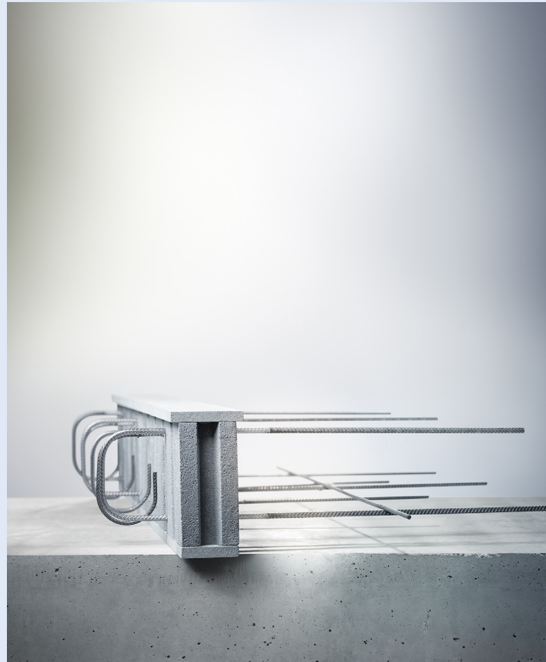
Schöck Rutherma® DF i

Au-delà de développer des solutions techniques toujours plus performantes, cette nouvelle FDES montre à quel point Schöck prend véritablement soin d'accompagner au mieux ses clients dans leur quotidien et confirme sa contribution pour une construction de qualité et bas carbone.