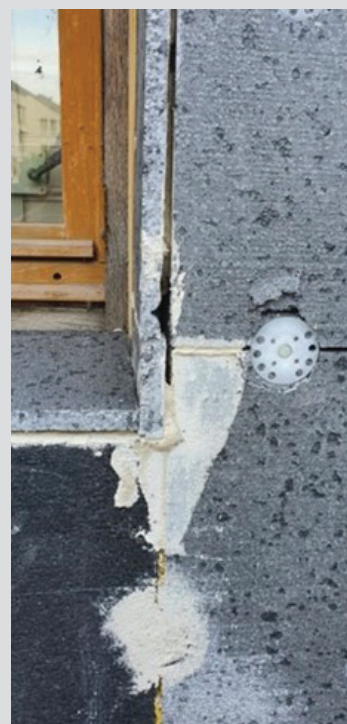
Isolant pour enduit non-jointif