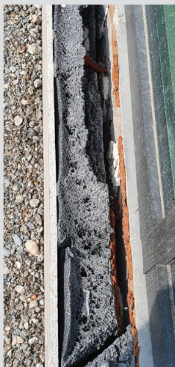
Isolant dégradé par le rayonnement solaire