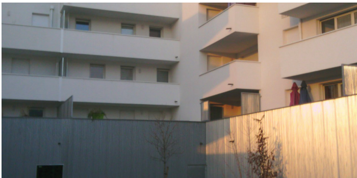
Mise en évidence par caméra thermique infrarouge de ponts thermiques conséquents pour ce nouvel ensemble immobilier.

Un axe jugé essentiel aussi pour l'atteinte des objectifs de baisse de la consommation d'énergie finale, de réduction drastique des émissions de gaz à effet de serre ou encore de neutralité carbone. Rappelons à ce titre que 40 % de la consommation d'énergie de l'Union européenne proviennent des bâtiments ainsi que 36 % des émissions de gaz à effet de serre qui sont liées à l'énergie. Pour la France, les émissions du bâtiment représenteraient désormais 18 % des émissions territoriales (en baisse notable depuis 2015, elles demeurent pourtant à un niveau très élevé). Et le Groupe de Travail met aussi en lumière dans le nouveau Livre Blanc, les résultats de la dernière étude du Buildings Performance Institute Europe, qui permet de démontrer que la rénovation complète des bâtiments résidentiels de l'UE entraînerait une réduction de 44 % de la demande d'énergie pour le chauffage des bâtiments, soit une économie de 777 TWh.