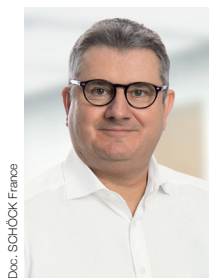
Doc. SCHÖCK France

Rappelons à ce titre que l'Observatoire de la Qualité de l'Air Intérieur estimait dans son rapport de 2014, que la qualité de l'air intérieur était à l'origine de pas moins de 20 000 décès annuels. En France, l'ANSES estime d'ailleurs entre 14 et 20 % le nombre de logements présentant des moisissures visibles. Un constat partagé par l'OMS qui confirme que « les problèmes liés à la qualité de l'air intérieur des bâtiments sont reconnus comme un important facteur de risque pour la santé humaine. » D'ailleurs, toujours selon l'OMS, « les ponts thermiques, une isolation inadéquate (...) peuvent créer une température de surface inférieure au point de rosée de l'air et produire de l'humidité », engendrant inéluctablement le développement de moisissures. Précisons par ailleurs que ces bâtiments, (les fameuses passoires thermiques aux étiquettes F et G, estimées à 5,2 millions d'unités soit 17 % du parc immobilier français) affichent des transactions jusqu'à 57 % moins chères que des biens identiques aux étiquettes de diagnostic des performances énergétiques « A ».