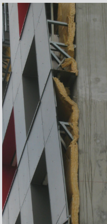
Isolant non fixé