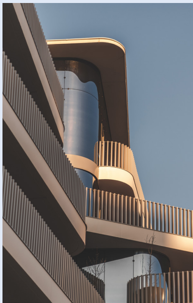
Résidence Canopée