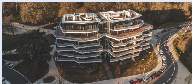
Résidence Canopée

A découvrir en détail sur www.schoeck.com/fr/40-ans-isokorb