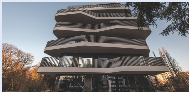
Résidence Canopée

Une expertise hors pair... Schöck France, filiale basée à Entzheim (près de Strasbourg), développe et commercialise un ensemble de solutions ultra-performantes de traitement de ponts thermiques. La gamme Schöck Rutherma® / Isokorb® répond aux différents défis des constructions en proposant des solutions sur mesure pour des liaisons béton-béton, béton-acier, acier-acier ou encore béton-bois.