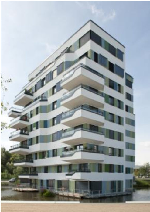
Foto2: Isokorb è l'elemento di raccordo strutturale tra le solette a sbalzo e il solaio interno dell'edificio e rappresenta l'alleato perfetto per il taglio termico degli elementi a sbalzo (balconi, gronde, tettoie, ecc.).