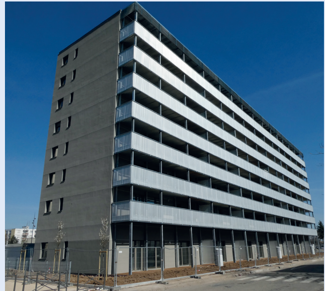
Labellisation Propassif pour cette résidence de la rue du Luxembourg à Colmar (68).

Consommation énergie de chauffage (selon PHPP) : 13 kWh/m 2 /an