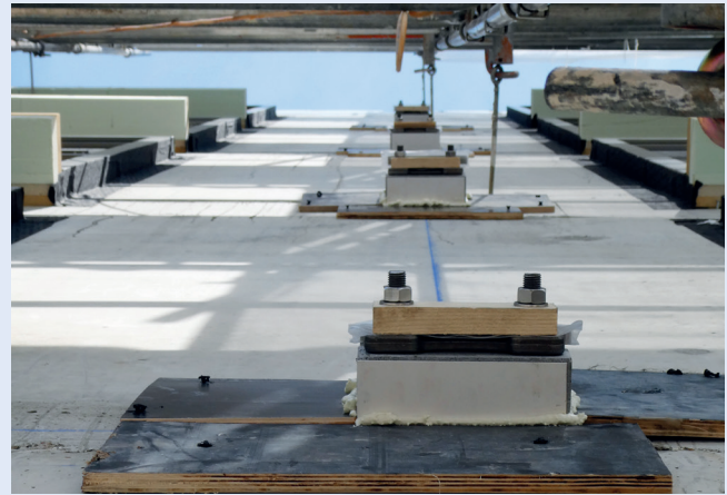
Mise en œuvre des rupteurs Schöck Isokorb® QS sur chantier pour assurer la continuité de l'isolation entre la structure en béton et les balcons métalliques sur appui.

Ainsi, dans la partie rénovée comme dans la partie neuve, plus de 180 rupteurs Schöck Isokorb® type KST, KST-ZST et KST-QST (reprenant, selon leurs dispositions, les efforts de traction, les efforts de compression et les efforts tranchants) ont été positionnés au niveau des balcons, en jonction entre la structure métallique porteuse et la dalle en béton. En effet, cette gamme de rupteurs Schöck, constitués d'éléments en acier inoxydable traversant un corps isolant en néopor, interrompt le flux de chaleur dans l'élément métallique : les supports, habituellement d'un seul tenant, sont désolidarisés et le rupteur mis en place dans l'espace intermédiaire assure la reprise des efforts structurels et la continuité de l'isolation thermique.