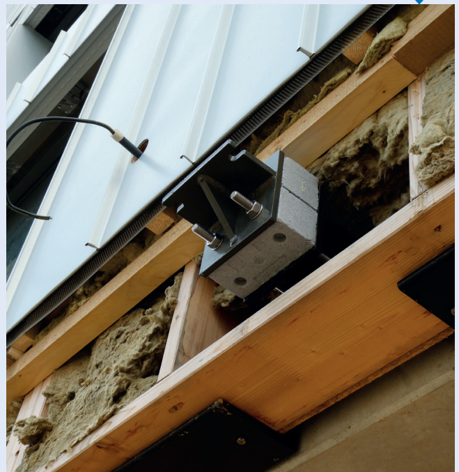
Mise en œuvre du rupteur Schöck Isokorb® KST pour assurer l'isolation thermique et le transfert des sollicitations structurelles de cette construction métallique.