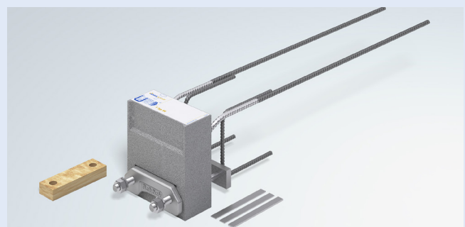
Schöck Isokorb® QS pour la liaison entre la structure en béton et la structure métallique sur appui.