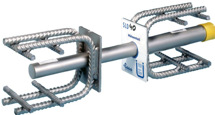
Mit dem Schöck Dorn Typ SLD kann eine Konstruktion ohne Unterzüge und Konsolen geschaffen werden, die als Deckenaufleger dient.