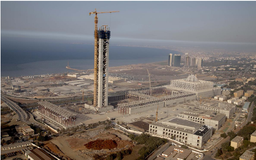
Die Djamaâ El Djazair Moschee entsteht nahe dem historischen Stadtteil Mohammadia entlang der Bucht von Algier an der Mittelmeerküste.