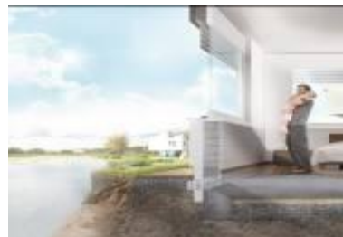
Bloczki termoizolacyjne Schöck Novomur oraz Novomur light przeznaczone są do domów jedno- oraz wielorodzinnych.

Mostki termiczne są przyczyną zwiększonej utraty ciepła, wilgotnych ścian oraz powstawania pleśni. Problem ten dotyczy takich miejsc jak cokół czy fundament. Odpowiednia termoizolacja tych obszarów pozwoli na wyeliminowanie niepożądanych następstw, co jest możliwe dzięki zastosowaniu bloczków termoizolacyjnych Schöck Novomur oraz Novomur light.