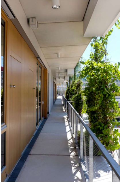
Foto 03 und 04: Die Flucht- und Rettungswege am Bildungshaus NeckarPark verlagerten die Planer als umlaufende Balkone über zwei Gebäudestrukturen und über alle Geschosse. Sie dienen zugleich als Wartungsgang für die fassadengebundene Begrünung.