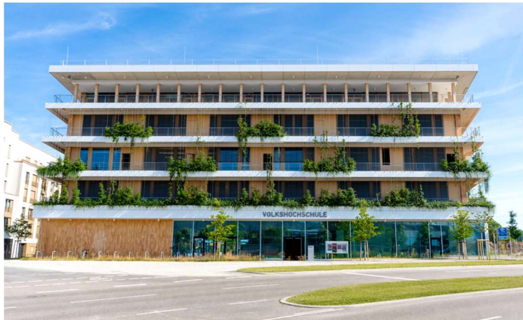
Foto 01 und 02: Das Projekt „Bildungshaus NeckarPark“ in Bad Cannstatt ist eines der größten und innovativsten Schulbauprojekte der Landeshauptstadt Stuttgart. Umlaufende Fluchtbalkone über alle Geschosse, an die eine Fassadenbegrünung mit Pflanztrögen angeschlossen ist, verleihen dem Bildungshaus sein markantes Äußeres.